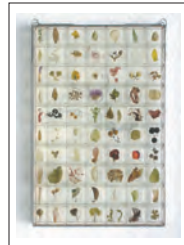
右: 鈴木亘彦 《Swamp of Mirror (植物)》 2008年/ガラス、鏡、合成樹脂、 植物/30.0×21.0×2.4cm