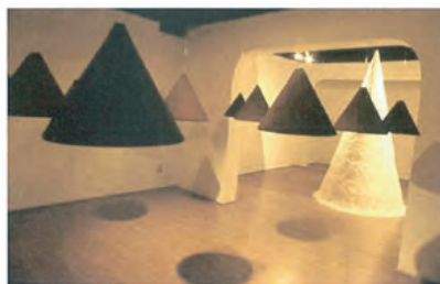
三梨伸《Black, White & Yellow》2000年/コーヒー

三梨は第21回サンパウロ・ビエンナーレへの出品以降、日本とブラジル両国での作品発表を続けています。今回はコーヒーパウダーを用いたインスタレーションをおこないます。鈴木は渡伯した時に受けた色彩の豊かさに対する記憶を透明感のある立体に表現しています。またチェッペは自ら制作した衣装を身につけ、その女性性を追及するような幻想的な映像作品、上西はポルトガル語の詩を日本の古地図と組み合わせるなど、自らのルーツを探求するような作品を制作しており、多様な作品が展示される予定です。