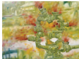
大岩オスカル《Arvore de Fogo》 2003年/油彩/89.0×119.0cm

7/3~15 神戸さんちかホール 7/19~8/31 松山三浦美術館 10/14~26 熊本県立美術館