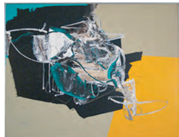
間部学《Sem Titulo》制作年不詳/ 油彩、キャンバス/102.0×127.0cm