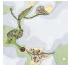
上西エリカ《In (Verses) Ways》 2007年/インクペン、和紙/ 76.0×76.0cm (8点組)