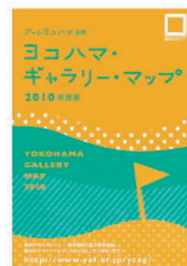
2010年度版ヨコハマ・ギャラリー・マップ

オススメ!⇒ 1年を通じて繰り返しご覧いただけるので、季節を問わずお店や画廊のご案内に