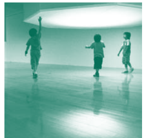
昨年度の様子・アトリエオモヤ「光であそぶ」

開館時間 10：00～17：00 ※最終日は20：00まで開館予定 休館日 8月23日(月) 入場無料 お問合せ 〒225-0012横浜市青葉区あざみ野南1-17-3 アートフォーラムあざみ野内 TEL: 045-910-5656 FAX: 045-910-5674 ホームページ http://artazamino.jp