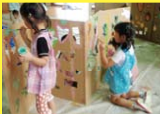
ワークショップのイメージ

作品搬入(出品の申込みと作品のお持込み)日: 7月16日(金)、17日(土) 応募資格: 横浜市内在住・在学の12歳以下の児童・幼児 応募できる作品: 平面作品(四つ切画用紙サイズ) 詳細は別途配布する募集要項兼チラシでご確認ください。