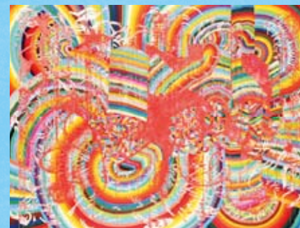
2 © 石山朔 & S.A.K.U.Project