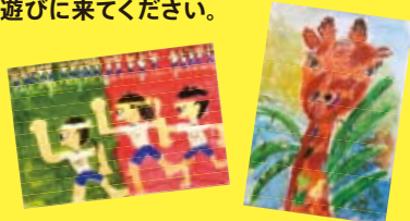
左: 金田美玲画《運動会》3年 右: 大野輝《キリン》5歳