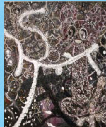
1 photo: 木奥恵三

1921年満州生まれ。日本大学在学中に学徒出陣。除隊後に長野県での教職を経て上京、新聞記者となる。傍ら制作を始め1960～70年代に画廊を中心に個展開催。個展に2007年「石山朔—O sole mio」(BnakART/横浜)、グループ展に2009年「マイ・アートフル・ライファー—描くことのよろこび」(京都造形芸術大学ギャラリー・オーブ/京都)など。