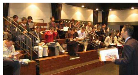
野毛まちなかキャンパス （横浜にぎわい座）