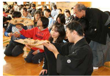
芸術文化教育プログラム