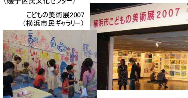
こどもの美術展2007 (横浜市民ギャラリー)