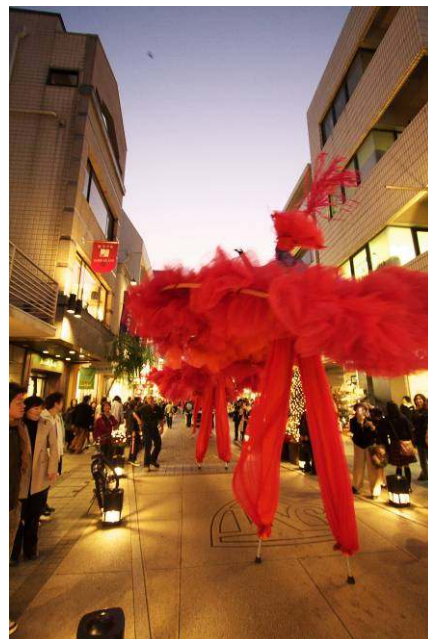
ヨコハマ・パフォーミング・アーツ・コンプレックスより 「レミューズ・ダイナモ」(元町ショッピングストリート)