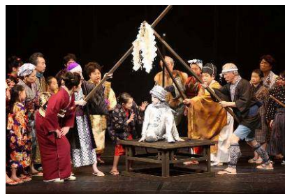
「奇妙奇天烈摩訶不思議 いそごの星のものがたり」 (磯子区民文化センター)