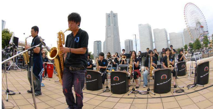
横濱ジャズプロムナード2007