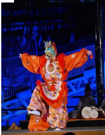
横浜あかりアーツコラボレーション2007 「天上の楽」-春日大社の雅楽- (横浜能楽堂)