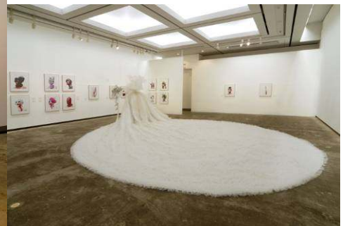
企画展「GOTH—ゴス—」 (横浜美術館)