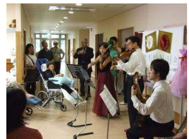
特別養護老人ホーム「椿寿」での演奏会 (岩間市民プラザ)