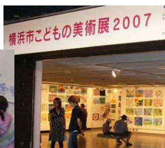
横浜市こどもの美術展2007