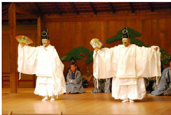
企画公演「もう一つの『翁』」(横浜能楽堂)