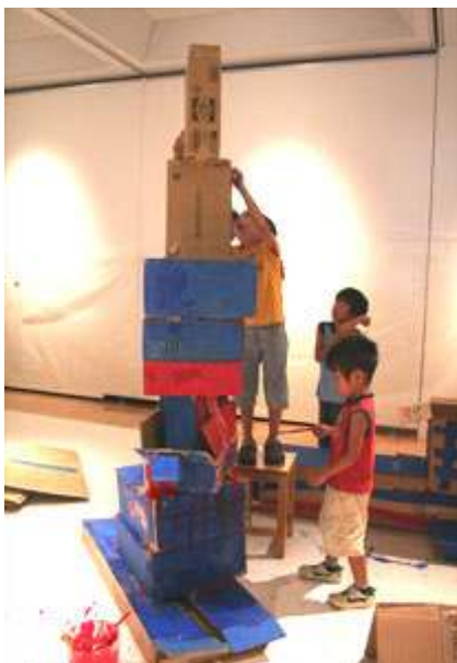
“夏の”こどもぎやらりい2007 (横浜市民ギャラリーあざみ野)

地域の特別養護老人ホームでクラシック音楽の生演奏を行うアウトリーチ事業で、普段コンサートホールへ来られない方々へ、芸術文化に親しむ機会を提供しました。