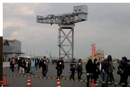
横浜トリエンナーレ 市民サポーターイベント