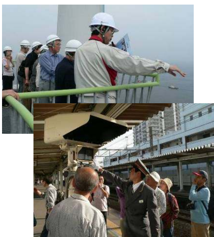
いそご文化資源発掘隊 （磯子区民文化センター）

横浜市内を中心に活動する自主映画制作サークルや映像作家を目指す人々から公募した作品を上映し、観客と審査員の投票により優秀作品を選ぶ、横浜発の市民映像祭を共同で開催し、活動を支援しました。