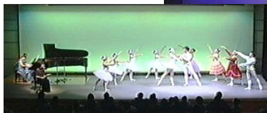
区民企画「白鳥の湖」 （旭区民文化センター）