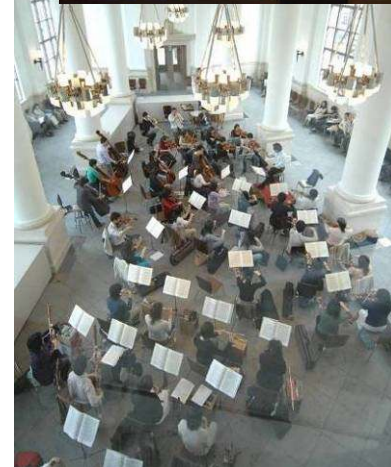
横浜オペラ未来プロジェクト2007 「ロッシェニ作曲オペラ『セヴィリアの理髪師』」 （横浜みなとみらいホール）