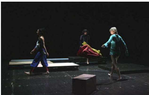
日本-フィンランド-韓国共同制作プロジェクト 「Ääressä ～かたわらで～」(横浜赤レンガ倉庫1号館)

日本・フィンランド・韓国のアーティストが、ディスカッションに始まり、それぞれの地勢、環境、文化の違いを理解し、お互いに吸収し合いながら創作を行うという、国際交流の中から新たな芸術創造を行いました。