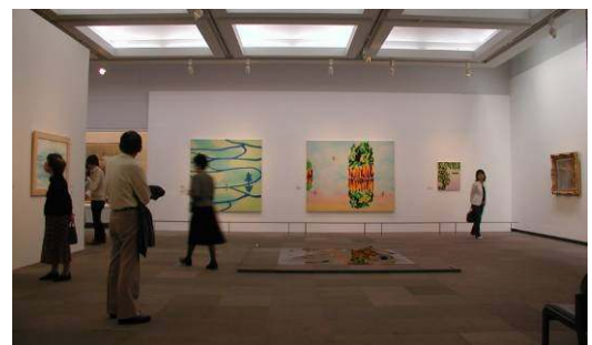
企画展「水の情景—モネ、大観から現代まで」 (横浜美術館)