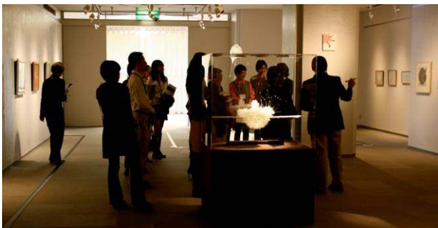
キュレトリアル・サポーター・プロジェクト 「横浜美術館ボランティアが出逢ったー若きアーティスト展」