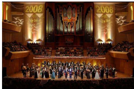
ジルヴェスターコンサート(横浜みなとみらいホール)