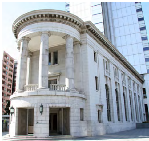
ヨコハマ創造都市センター（旧第一銀行横浜支店） 所在地：横浜市中区本町6-50-1

<本資料へのお問合せ> 花形、池尻 tel.045-221-0325 ycc@yaf.or.jp Url. www.yaf.or.jp/ycc/