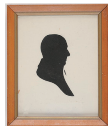
左から 《指紋カメラ》 イーストマン・コダック フォルマー・シュウィング・ディヴィジョン 1917年 《M・アレクサンダー大佐のシルエット》 制作者不詳 1730年