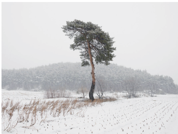
《Untitled #355》Seorak 2008年 C-Print 237.2 × 307.2cm