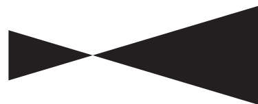
あざみ野 フォト・アニュアル