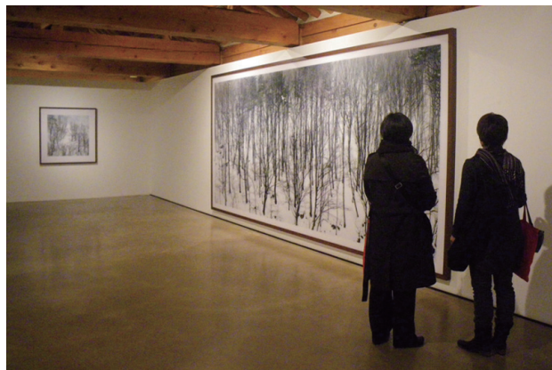
「BOOMOON SANSU&NAKSAN」2011年 學古齋ギャラリー（ソウル）での展示風景

本展では、自然の微細な変化のあわいをうつしだしたスケールの大きな作品群で約300㎡の展示空間をいかしたダイナミックな構成を行い、超常的な時間・空間を出現させます。