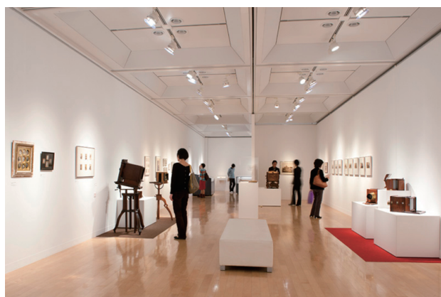
「横浜市所蔵カメラ・写真コレクション展」(2010年)の展示風景