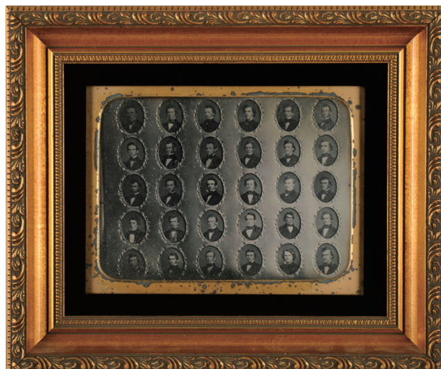
《医学校クラス写真》制作者不詳、1850年、ダゲレオタイプ